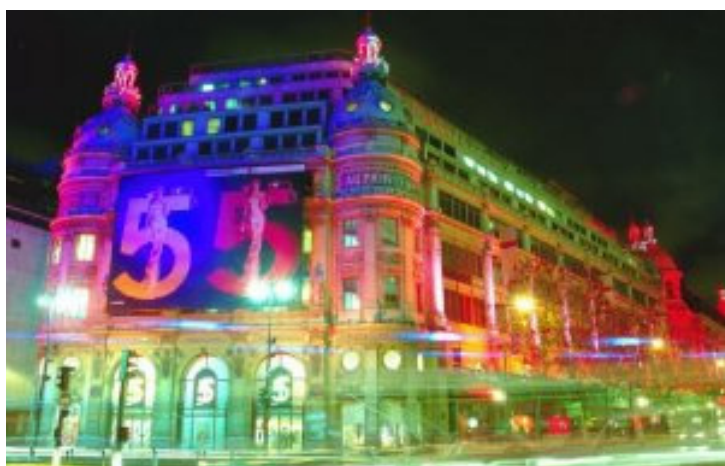
Grands magasins du boulevard Haussmann